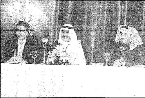
السفير والملحق الثقافي