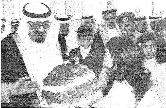
خادم الحرمين يتسلم باقة ورد من طفلة

■ ١٣٨ منشأة تعليمية جديدة و ٨ كليات ومعاهد تقنية