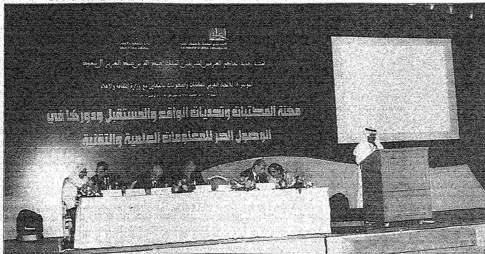
جلسات امس ركزت على أهمية التواصل العلمي بين مرافق المكتبات ومراكز المعلومات

رحب رئيس الاتحاد العربي للمكتبات والمعلومات سعد الزهري في كلمة له بالمشاركين في المؤتمر مؤكداً على أهمية هذا المؤتمر من أجل بحث واحد من أهم الموضوعات (مهنة المكتبات وتحديات الواقع والمستقبل ودورها في الوصول للمعلومات العلمية والتقنية). وأوضح أن المؤتمر يعد فرصة لإطلاع المشاركين من مختلف دول العالم على النقلة التي تشهدها المملكة في مجال المكتبات والمعلومات