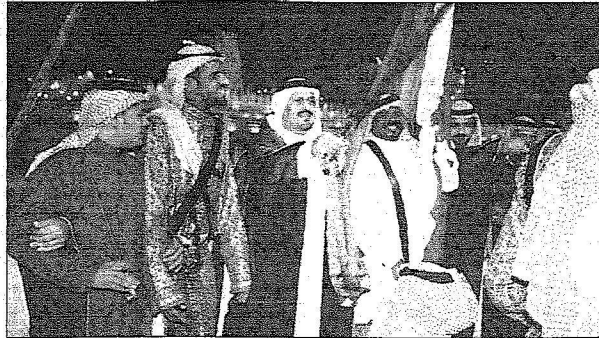
احتفالات حائل بعيد الفطر المبارك