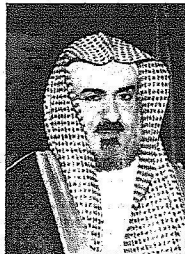
د. أبا الخيل

قال مدير جامعة الامام محمد بن سعود الإسلامية رئيس مجالس كراسي البحث الدكتور سليمان بن عبد الله أبا الخيل ان «كرسي الأمير نايف للدراسات الوحدة الوطنية» له دلالات عميقة ومعان قوية دينية ووطنية ودينية في نفس الوقت لأن هذا الكرسي بهذا المفهوم، كما أطلق عليه البعض هو «أبو الكراسي»، فالوحدة الوطنية التي عاشتها المملكة وتعيشها الآن هي أساس كل بناء وقوة وازدهار ولذلك فإن ما سبقه عليه هذا الكرسي من برامج ومناشط سيحقق الهدف والغاية النبيلة التي يسعى إليها سموه حفظه الله ويعمل من أجل تحقيقها،