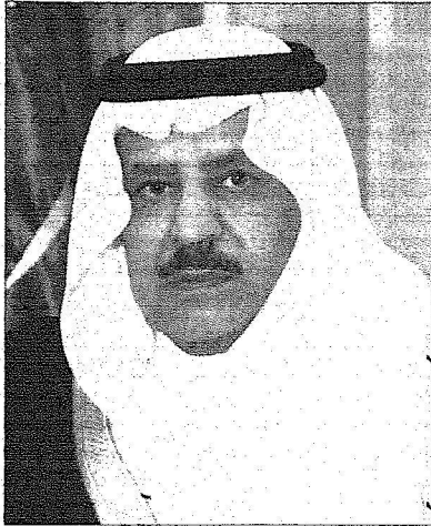
الأمير نايف بن عبدالعزيز