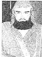
د. عبد الرحمن السديسي