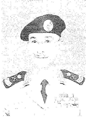
اللواء منصور التركي

حتى الآن من معتقلي خليج جوانتانامو، مشيراً إلى أنه تم إطلاق سراح (٨) أشخاص من المعتقلين بعد إجراءات التحقيق وتوفر معلومات تؤكد عدم تورطهم في قضايا أمنية.