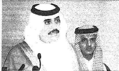
أمير المنطقة الشرقية .. تقابل مع الأحداث

حوار: عبد العزيز الفكي وممدوح عيسى من الدمام