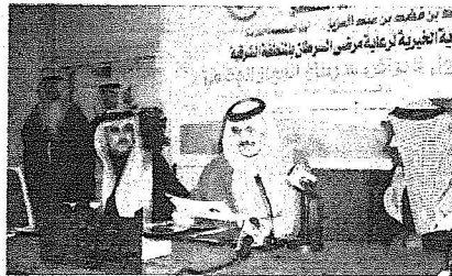
.. ورعاية متواصلة