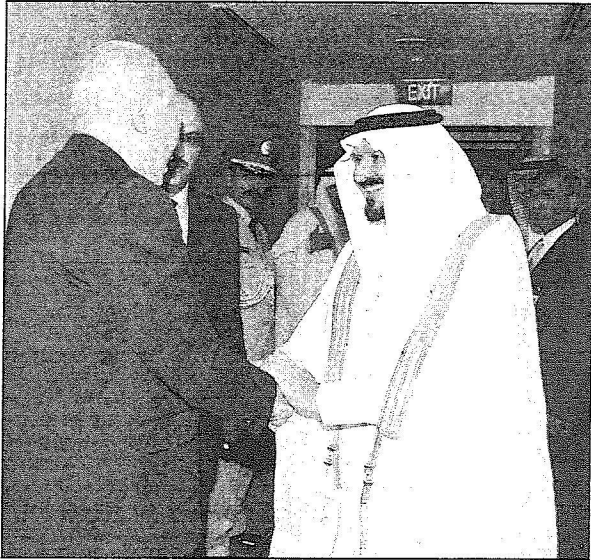
الأمير سلطان لدى استقباله لدولة الوزير الناصح، «واس»

مصلحة الجانبين من خلال تشجيع وزيادة حجم الاستثمار والتبادل التجاري بين البلدين الصديقين.