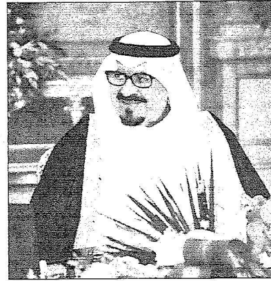
نائب خادم الحرمين الشريفين خلال ترؤسه جلسة مجلس الوزراء