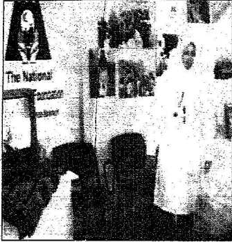
الجانب الصحي في المهرجانات