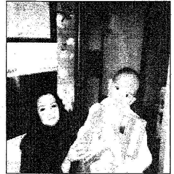
أحد الأطفال يقبل محبته

العمل الجماعي يعتبر أساس نجاح النشاطات الخيرية والخطط المساندة لها