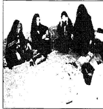
بعض الأسر المستفيدة