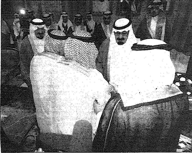
خادم الحرمين خلال الاستقبال بحضور ولي العهد