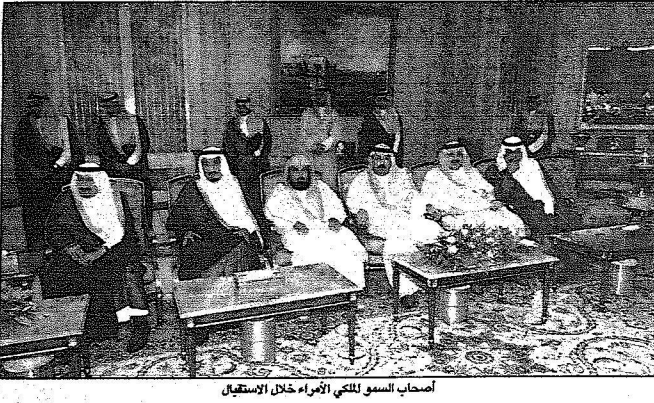
أصحاب السمو الملكي الأمراء خلال الاستقبال