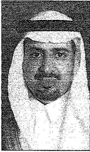
رئيس مركز جلال