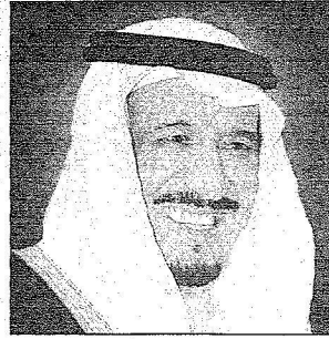
سمو امير منطقة الرياض

هذا العهد الزاهر تطوراً وازدهاراً في كل النواحي وفي شتى المجالات، وأخص بالذكر منطقة الرياض إذ تحظى بالاهتمام الكبير من لندن صاحب السمو الملكي الامير سلمان بن عبد العزيز أمير منطقة الرياض وسمو نائبه صاحب السمو الملكي الامير سطام بن عبد العزيز اللذين أعطيا المنطقة ومحافظةها جل وقتهما وكامل جهودهما لتواكب بذلك التطورات التي تشهدها بلادنا الغالية، وهو أمر يحقق سياسة راعي نهضتها خادم الحرمين الشريفين وسمو ولي عهده الأمين كما أشار رئيس مركز جلال إلى أن وضع حجر الأساس وتدشين المشاريع التنموية الحكومية منها والشعبية، جاء نتيجة لما تشهده المحافظة اليوم من تطور في كافة المجالات العمرانية والزراعية والصناعية بوجود محافظها المحبوب سمو الأمير عبد الرحمن بن عبد الله بن فيصل آل سعود الذي كان له الفضل بعد الله سبحانه وتعالى في دفع عجلة التنمية في المحافظة بحنكة إدارية قنيدة .. هذا وتمنى سعاداته أن يحفظ الله سموه الكريم في حله وترحاله داعياً الله أن يديم هذا الأمن والأمان على بلادنا الغالية في ظل قيادتها الحكيمة.