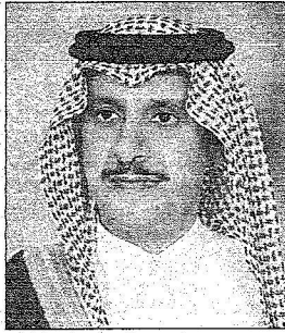
سمو محافظ الجمعة