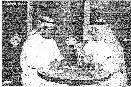
مدير عام الصندوق يتحدث للزميل العتيبي

وسيراليون في تعزيز البرامج الوطنية المعنية بتوفير المواد الغذائية لجميع المواطنين . وستقسم المنحة على النحو التالي ٢٥٠,٠٠٠ دولار أمريكي لكمبوديا و ٢٠٠,٠٠٠ دولار أمريكي لهايتي فيما ستحصل سيراليون على ٣٠٠,٠٠٠ دولار أمريكي. اما المنحة الثانية والتي تبلغ قيمتها ١٥٠,٠٠٠ دولار أمريكي فتهدف إلى تمويل مشروع بناء مركز طبي في بلدة براقايل في محافظة عكار بلبنان حيث الاضرار البالغة التي خلفها العدوان الاسرائيلي . ومن المتوقع لهذا المركز الطبي ان يقدم خدماته لما يناهز ٨٠,٠٠٠ مواطن بحاجة ملحة الى العناية الطبية. وقد قدم منذ انشائه حتى الآن ما يناهز ٨,٥ بلليون دولار أمريكي لتمويل المشروعات الانمائية الملحة بشروط ميسرة في ١٢٠ بلداً من البلدان النامية. ملا شربت لنا العلاقة بين الصندوق والمنظمة ؟ - إن صندوق الأوبك للتمنية الدولية "أفيد" منظمة دولية مستقلة انشأتها الدول الأعضاء في منظمة "أوبك" عام ١٩٦٦م ومقرها مدينة