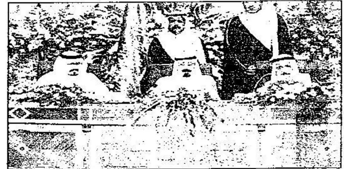
خادم الحرمين يرفع حفل جامعة القصيم