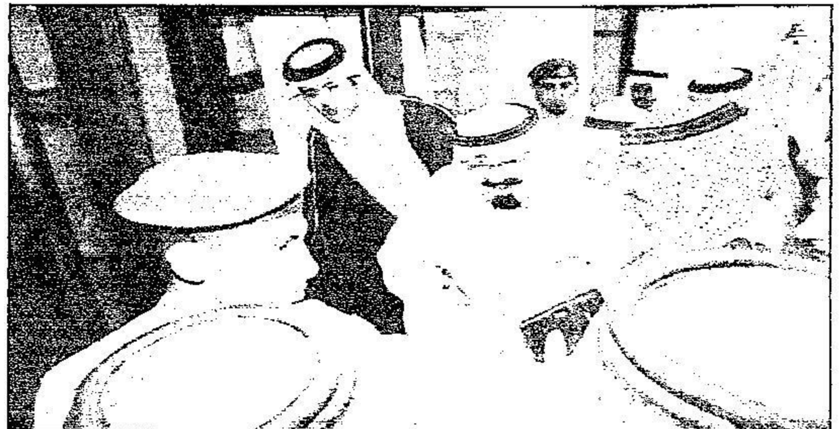
خادم الحرمين يصافح أحد السواتين