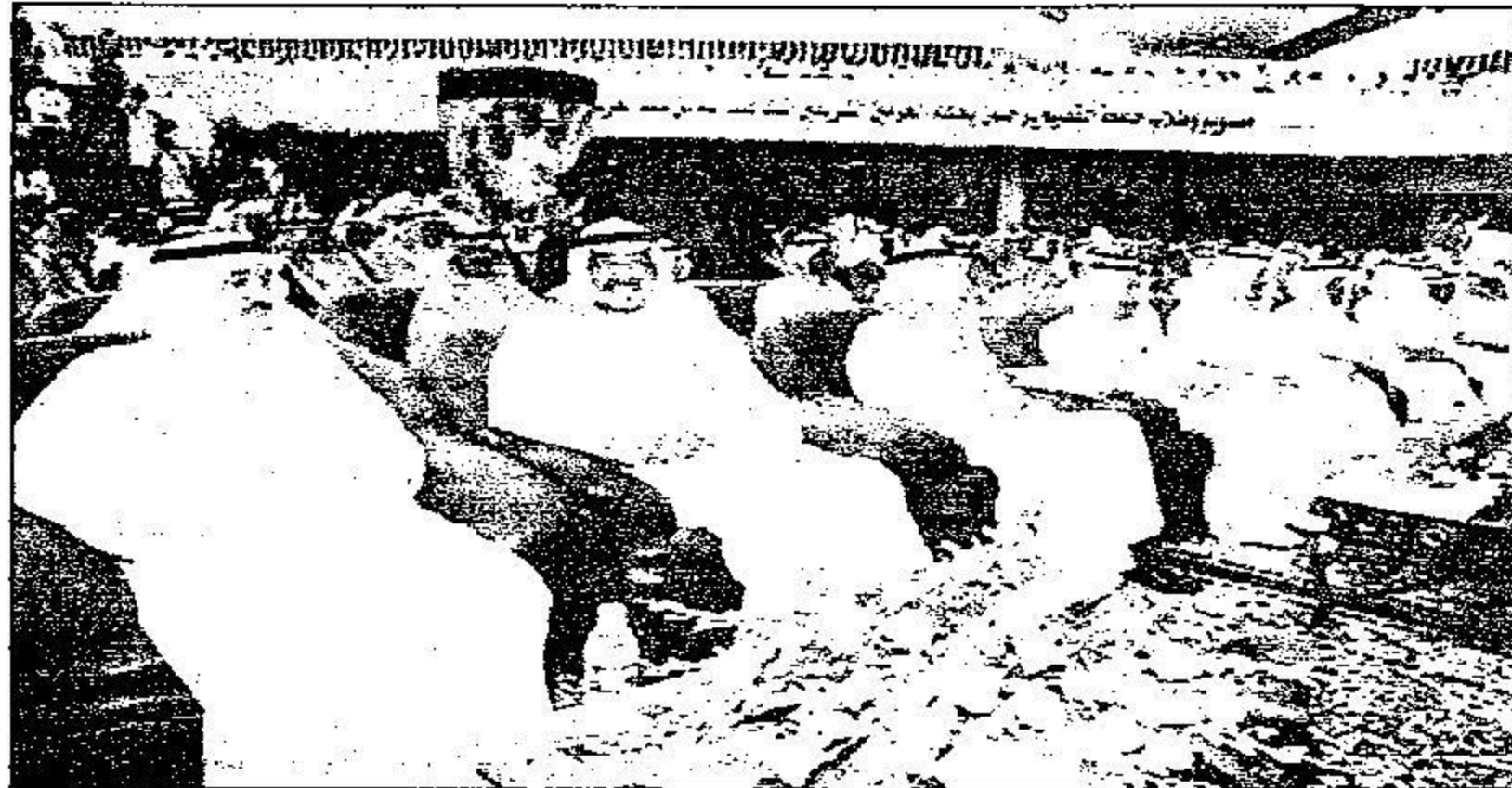
عدد من أصحاب السمو الملكي أثناء حضورهم الحفل