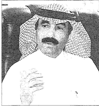
المهندس الطوب : المنطقة مقبلة على نهضة كبيرة