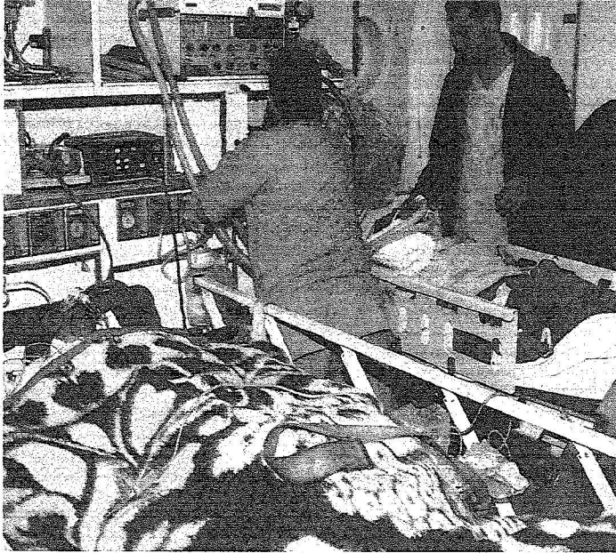
مصايو فلسطين في أحد مستشفيات المملكة.