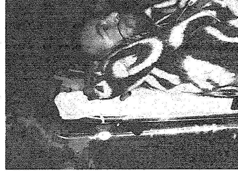
الدفعة الثالثة من المصابين وصلت إلى المملكة.