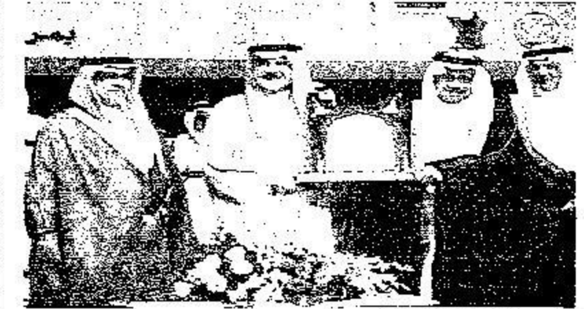
تكريم مركز الملك فهد الثقافي