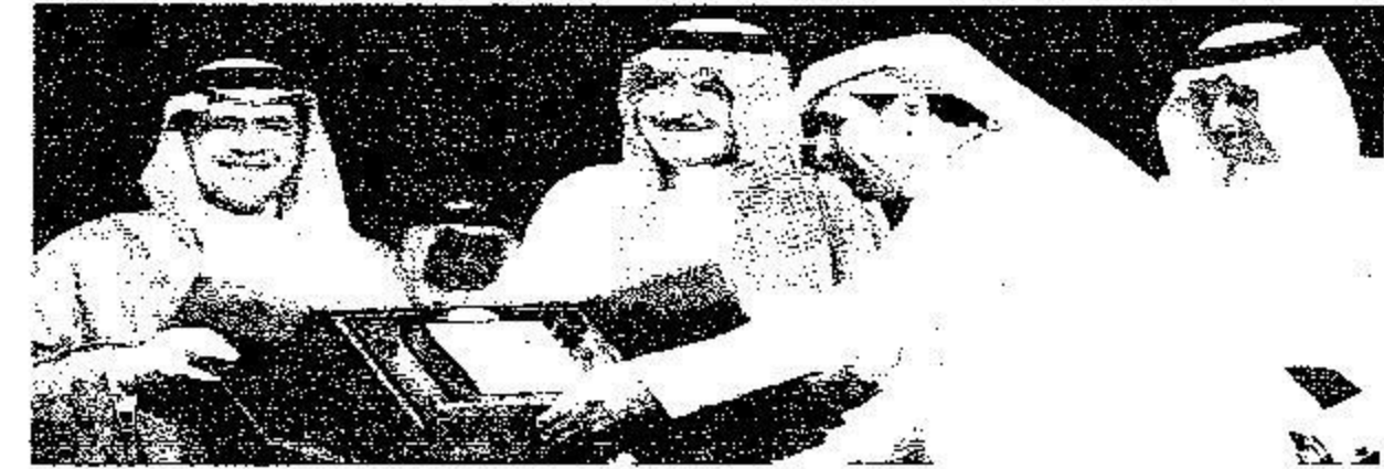
دعوى تذكارية للأمير سلطان