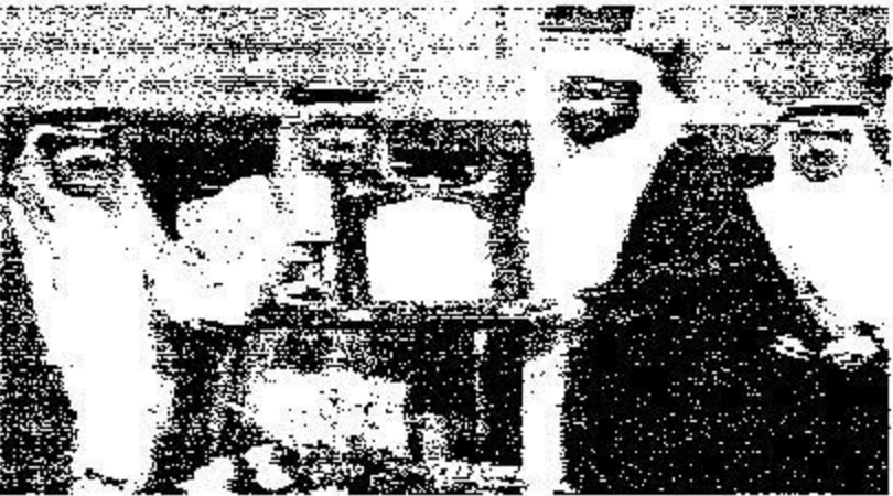
تكريم مجموعة العليان