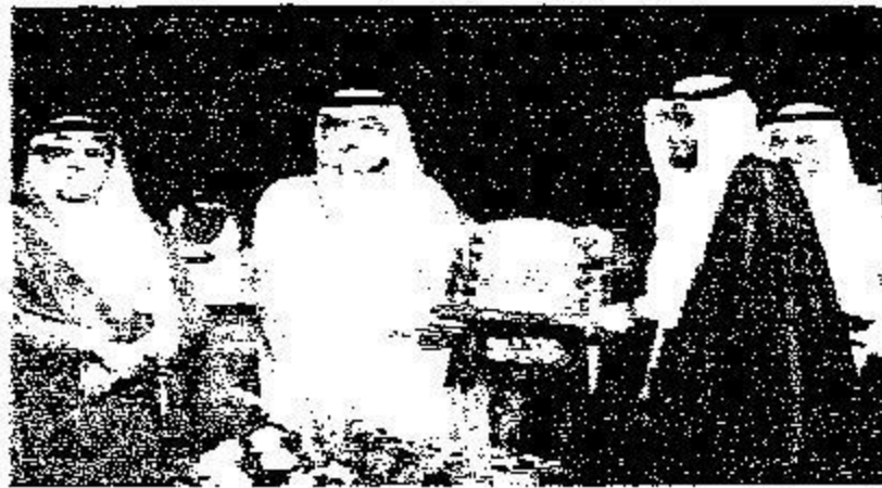
تكريم شركة التجميع العايفضة