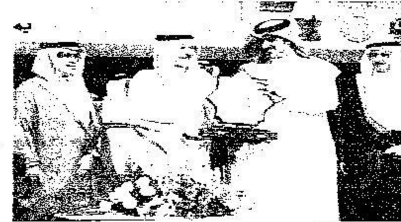
تكريم نجوم للأعراس