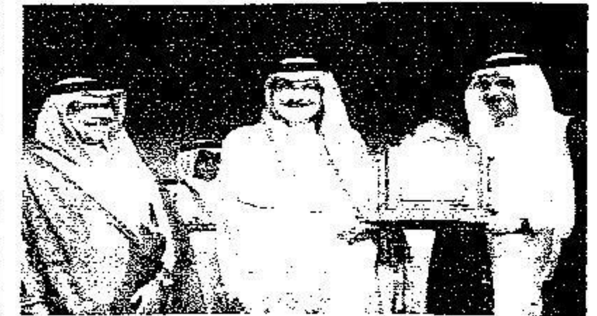
تكريم وزارة الشؤون الاجتماعية