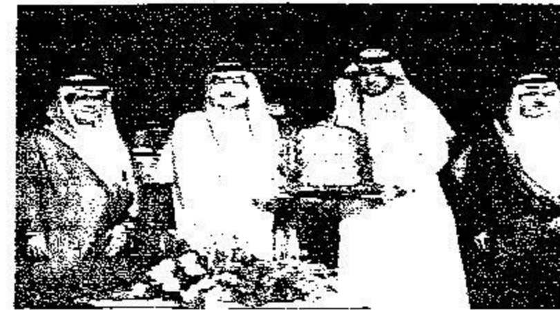
تكريم بنك الرياض