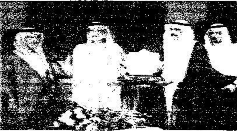
تكريم شركة الصراعي