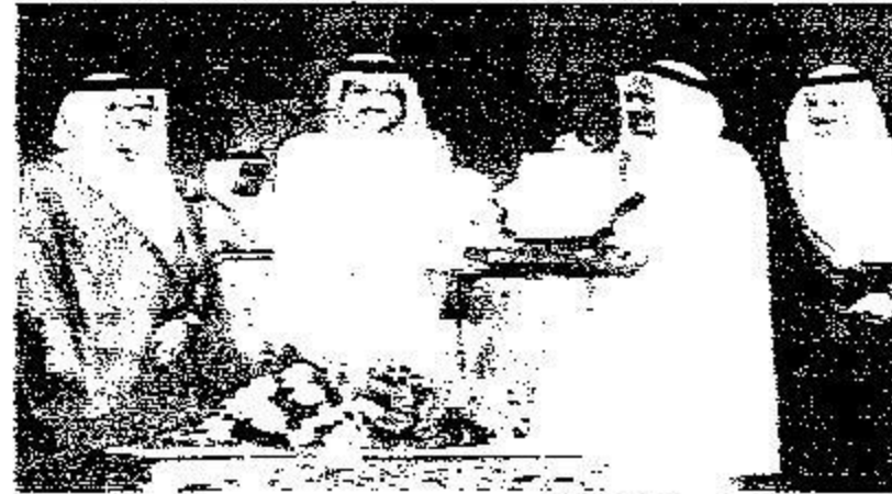
تكريم مؤسسة بن سعاد للمقاولات