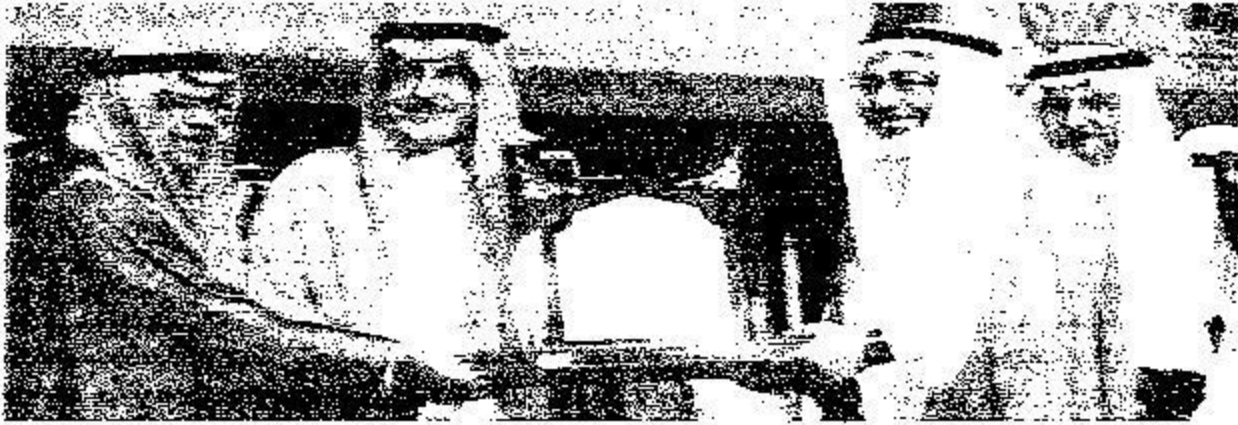
تكريم شركة التصنيع الوطنية