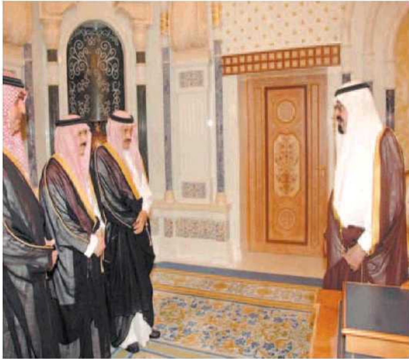
خادم الحرمين مستقبلا لسفراء المعينين لدى عدة دول الذين أدوا القسم بين يدي الملك.