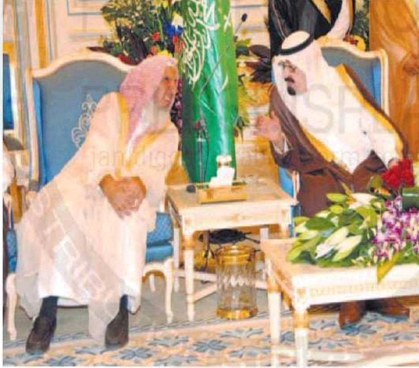
الملك خلال استقباله الأمراء والوزراء وكبار المسؤولين ومفتي المملكة والعلماء والمشايخ. واس.