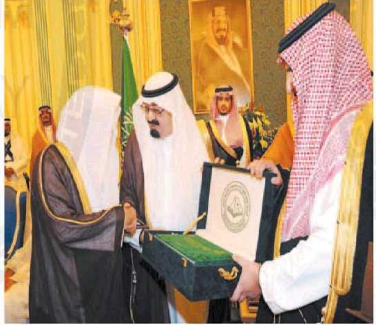
خادم الحرمين الشريفين يتسلم التقرير السنوي لهيئة الأمر بالمعروف والنهي عن المنكر من رئيسها الشيخ عبدالعزيز الحمين.