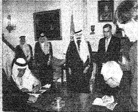
الصفاء ووزير الخزانة البريطاني يوقعا اتفاقية منع الإبراج الضريبية.