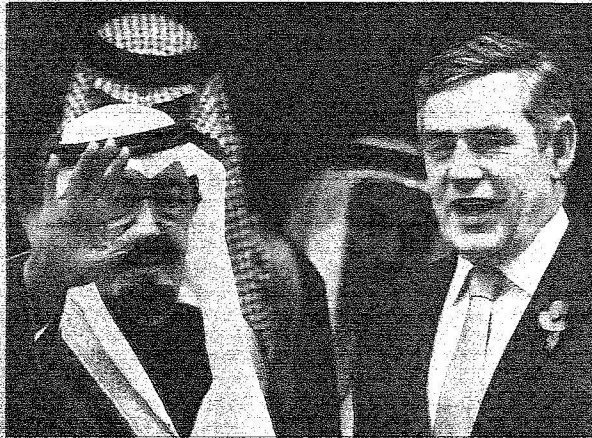
الحرمين الشريفين وعدد من اجضاء الحكومة البريطانية وحضر مراسم التوقيع الوفد الرسمي المرافق لخدام عبد العزيز وليس الوزراء البريطاني جوردن براون