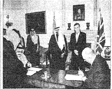
الأمير محمد بن نواف وشيفر بريطانيا يوقعا مذكرة التفاوض السياسي.