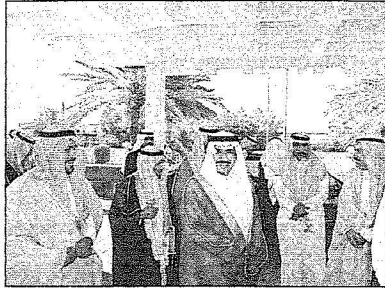
سموه أثناء استقبال معاليه ووفد الوزارة للمصاحب

الجلسة التأكيد على احتياجات الشؤون الصحية بالمنطقة على وجه السرعة في العديد من برامج التشغيل الذاتي منها تركيز أمراض وجراحه القلب التخصصي وزيادة الاعتمادات المخصصة للتشغيل الذاتي مستشفى الملك خالد ومستشفى النساء والولادة وزيادة تخصصات المنطقة الصحية وإنشاء المباني للاحتياجات المستقبلية لجراحة القلب والأبراج الطبية والمراكز التخصصية ومستشفيات ومراكز صحية لحافظات وقرى المنطقة ومتابعة تنفيذها من قبل فريق عمل مكون من مجلس المنطقة ووزارة الصحة حتى تكون واقعا مشامدا يؤدي خدمات بالمنطقة. وفي نهاية الجلسة تم التوصل إلى القرارات المناسبة.