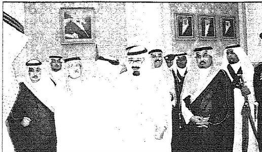
وصول خادم الحرمين الرياض ،واس،

العامه وصاحب السمو الأمير فيصل بن عبدالله بن محمد آل سعود وزير التربية والتعليم وصاحب السمو الأمير تركي بن عبدالله بن محمد آل سعود مستشار خادم الحرمين الشريفين وصاحب السمو الملكي الأمير عبدالعزيز بن عبدالله بن عبدالعزيز مستشار خادم الحرمين الشريفين وصاحب السمو الملكي الأمير منصور بن ناصر بن عبدالعزيز مستشار خادم الحرمين الشريفين وصاحب السمو