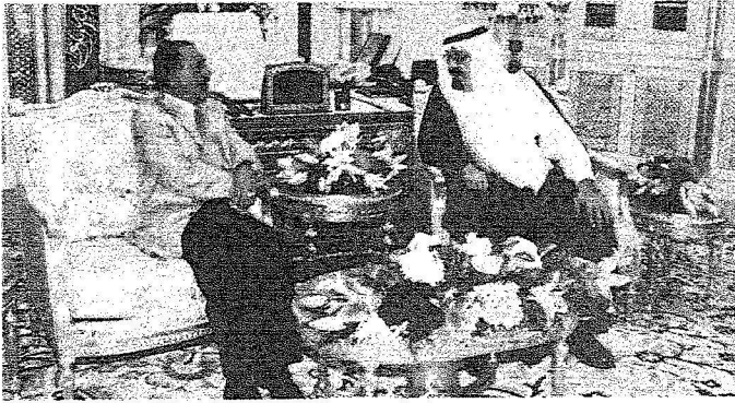
خادم الحرمين الشريفين لدى استقباله الرئيس اليمني في الرياض أمس