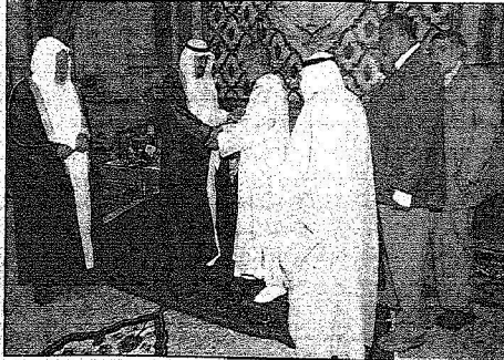
خادم الحرمين مستقبلاً د. التركي ومسؤولي الرابطة وهيئة المنظمات الإسلامية بوجاهة