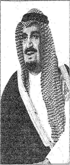
الأمير مشعل بن عبدالعزيز

عبدالله العريخي : عرة (ماتيا) اعرب صاحب السمو الملكي الأمير مشعل بن عبدالعزيز آل سعود رئيس هيئة البيعة عن عظيم اعتقاده وتقديره لخادم الحرمين الشريفين الملك عبدالله بن عبدالعزيز آل سعود مكرمة عالية بتعيينه رئيساً لهيئة البيعة في أول تشكيل لها منذ صدور نظامها في رمضان قبل الماضي