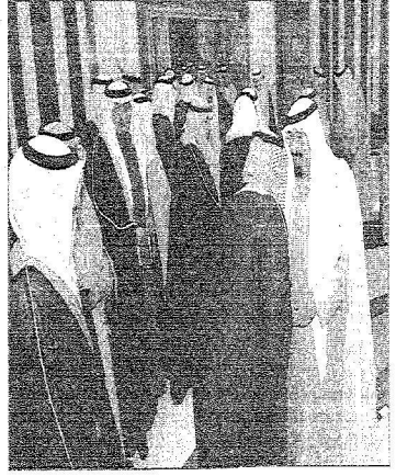
الملك عبدالله لدى استقباله الأوفد