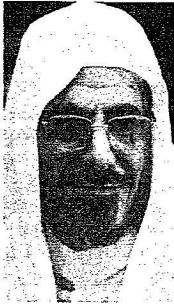
صالح بن حميد

10 مدرسة للبنين والبنات يريده قبل افتتاح المدارس الحكومية بنجد والشرقية