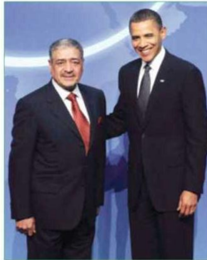
الرئيس أوباما لدى استقباله الأمير مقرن