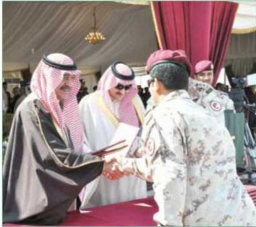
يرعى تفریح إحدى الدورات العسكرية