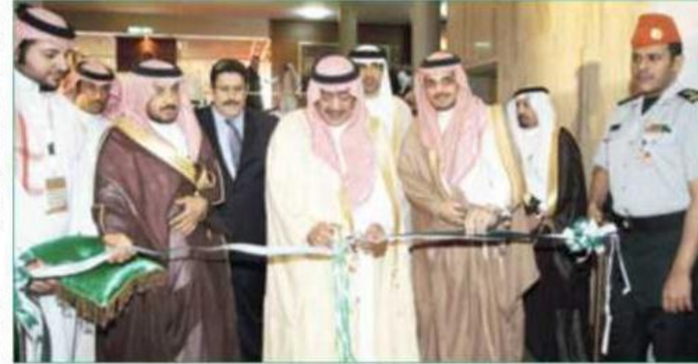
سموه مفتتحاً موسوعة الملك عبد الله للمحتوى الرقمي

يُذكر أن الأمير مقرن كان ضمن أقوى ٥ شخصيات استخباراتية في منطقة الشرق الأوسط العام الماضي، بحسب مجلة «فورين بوليسي» الأمريكية.