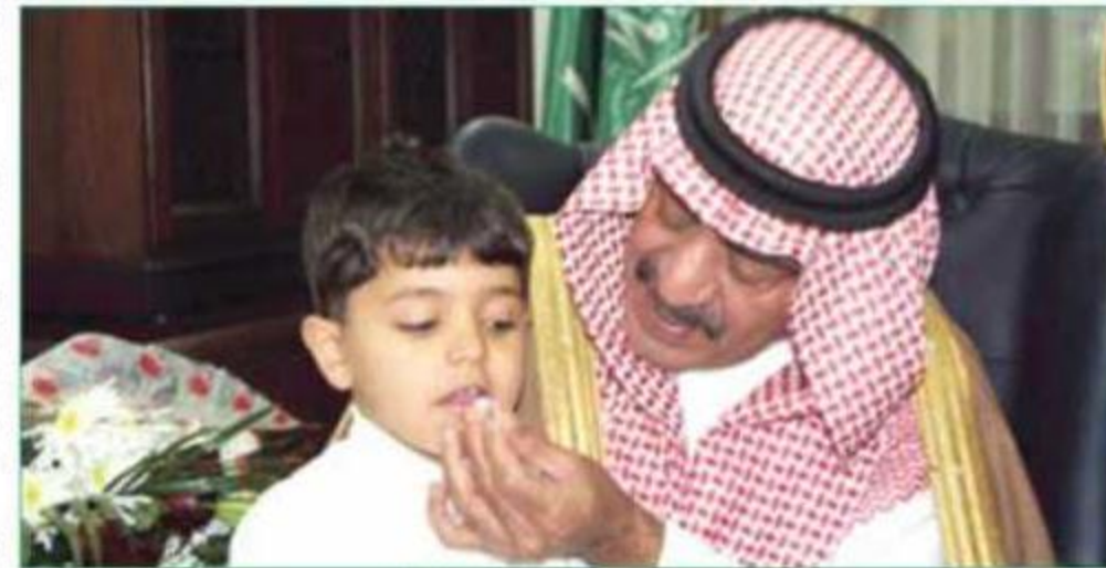
سموه يهتف حملة التطعيم في المدينة المنورة

مكانته من عدة وجوه: الأول أهمية الأ يبقى منصب النائب الثاني شاعراً مع أهمية أشغاله وثانياً أن الظروف الراهنة في منطقة الشرق الأوسط تستوجب ملء الشواغر في الإدارة العليا وثالثاً أن الأمير مقرن من الجيل الجديد ضمن أبناء الملك المؤسس وبالتالي لابد أن ينظر المراقبون إلى دلالة تلك الوجوه ويعيروها كثيراً من التأمل والتحليل. وختم العسكر حديثه بتأكيد أن الحصيلة النهائية في التحليل السياسي والإداري ستصحب في صالح ذلك التعيين.