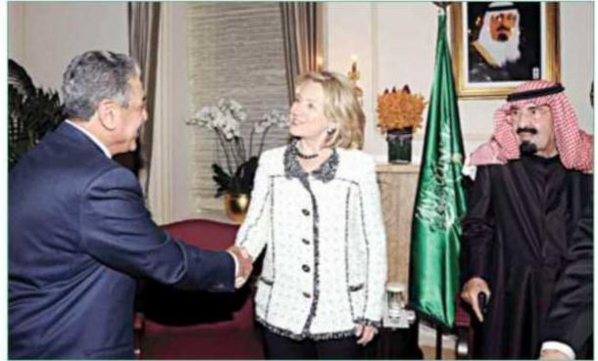
الأمير مقرن مصافحا كابينتون خلال استقبال خادم الحرمين لها