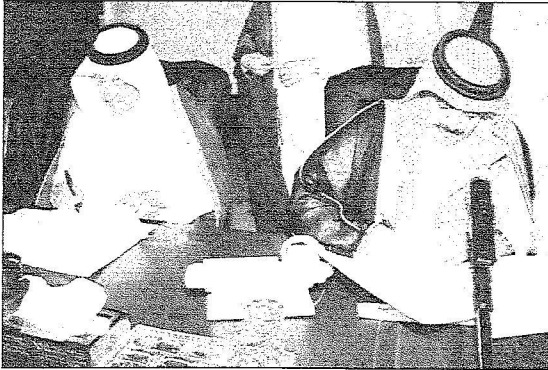
الأمر خالد الفيصل يوقع اتفاقية رعاية الحملة مع المهندس سعود الدويش

أكد المهندس سعود بن ماجد الدويش رئيس مجموعة الاتصالات السعودية أن الإعداد المتكامل لشركة اتصالات السعودية يتميز ما تقدمه من خدماتها المتنوعة لحجاج بيت الله الحرام بعد ترجمة عملية تنفيذ توجيهات خادم الحرمين الشريفين بشأن القيام على راحة ضيوف الرحمن والوقوف على سبل راحتهم واستقرارهم.