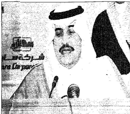
سوه بلقي كلمته بعنه المناسبة