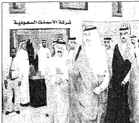
سوه في جولة للعرض بالعمد