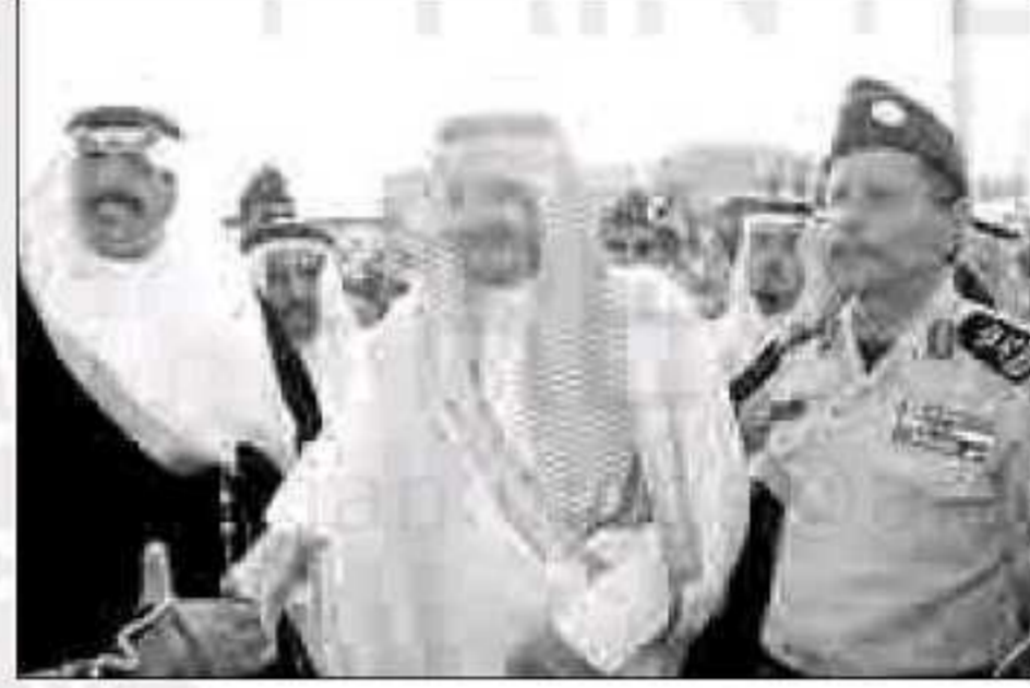
لقطات من جولة سموه

◆ النجاح والإقبال على قرية عسير يسجل للرجال المخلصين لوطنهم