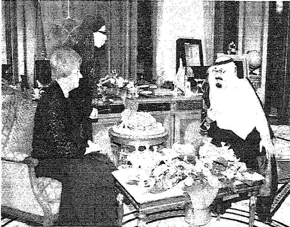
الملك خلال جلسة المباحثات التي عقدها مع الرئيسة الفنلندية في قصره في جدة أمس.