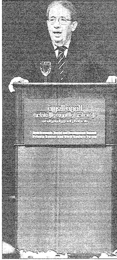
عمرو موسى يلقي كلمة أمام منتدى القطاع الخاص والمجتمع المدني على هامش القمة الاقتصادية العربية في الكويت أمس...