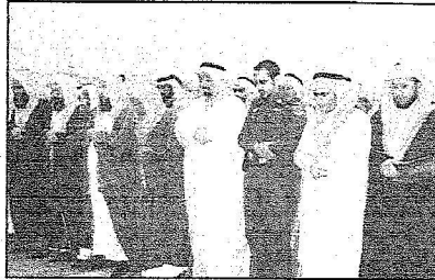
ناكف أمير الشرقية يتقدم المصلين