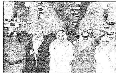
الأمير عبدالعزيز بن ماجد يتقدم المصلين