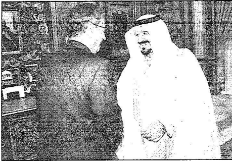
ولي العهد وامين الجامعة العربية خلال استقبال خادم الحرمين له.

وقد أعرب خادم الحرمين الشريفين حفظه الله عن شكره وتقديره للجميع وقال أيده الله: لا أستحق هذا الشكر لان هذا واجبي الديني وواجبي الوطني وواجبي الاخلاقي، وأتمم ولله الحمد ماضيكم عاظم ومعاضيكم من أب ومن جد الى جد مع هذه العائلة ومع هذا البلد.