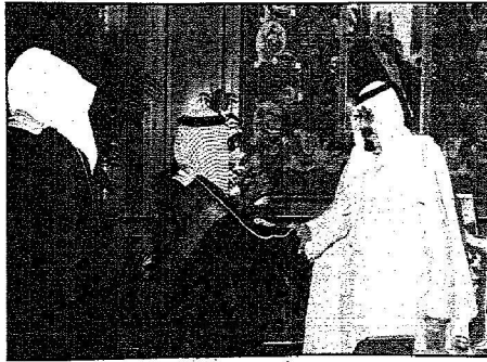
خادم الحرمين يستقبل أعضاء مجلس الشورى من المناطق الجنوبية