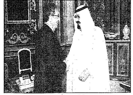
خادم الحرمين يستقبل عمرو موسى

بحث وموسى الأحداث والتطورات على الساحة العربية.. واستقبل السفير البحريني وأعضاء مجلس الشورى من المناطق الجنوبية