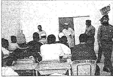
نزلاء با صلاحية الحائز في اول يوم دراسي