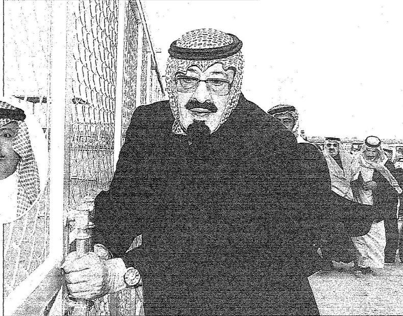
« الجزيرة » - عبدالله الجبيري

قدر صاحب السمو الأمير بندر بن سعود بن محمد آل سعود الأمين العام للهيئة الوطنية لحماية الحياة الفطرية وإنمائها دعم ضامم الحرمين الشريفين الملك عبدالله بن عبدالعزيز آل سعود - حفظه الله - وصاحب السمو الملكي الأمير سلطان بن عبدالعزيز آل سعود ولي العهد نائب رئيس مجلس الوزراء وزير الدفاع والطيران والمفتش العام ورئيس مجلس إدارة الهيئة لأعمال الهيئة وبرامجها وقال سموه: إن هذا يتضح من الدعم المستمر لمبادرات الهيئة وزيادة مطردة في ميزانيتها من عام لآخر.