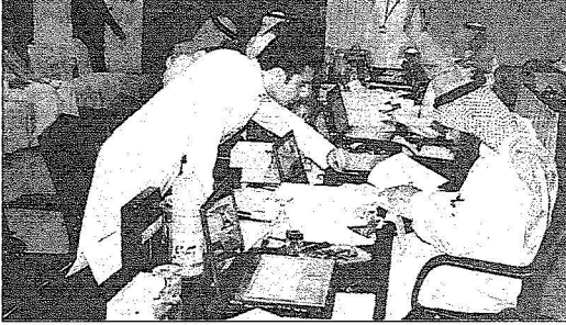
مبتعثون ينتظرون دورهم