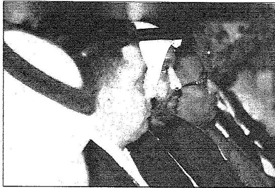
جانب من حضور جلسات منتدى التنافسية في يومه الأخير

تضيق الحنذي والمغامرة، فيجب أن توفر لهم البيئة المناسبة وتتعامل مع قضايا كبيرة في التعليم، وهذا ما تقوم عليه في جامعة الملك عبد الله للعلوم والتقنية، لتحقيق الانسجام بين التعليم والبحث والتعلم في مجالات الطاقة، فهذه عملية مشتركة، نحن نريد أن نصنع قادة ورواد لهذا المجتمع، لمتلائم روح المغامرة، فالعلم لا يؤدي للاختراع والإبداع، فنحن بالتأكيد لا بد أن نعمل على تطوير العلاقة بين العلم والبحث، وبالتالي تنمية روح الاستمرار".