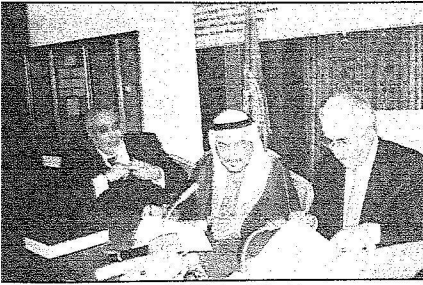
مراسم التوقيع على اتفاقية المخطوطات

أكد العديد من المسؤولين الأتراك والمتفنين على مكانة الملحة الرموزة لدى حكومة وشعب تركيا الشقيق من خلال ترفيقهم لزيارة خادم الحرمين الشريفين لتركيا، وتسد المسؤولين على مساهمة الأيام الثقافية السعودية التي أقيمت على مدار أسبوعين في نقل صورة الشعب السعودي وتراثه وتقاليد إلى الشعب التركي من خلال البرامج التي نفذتها وزارة الثقافة والإعلام ممثلة في وكالة الوزارة للعلاقات الثقافية الدولية.