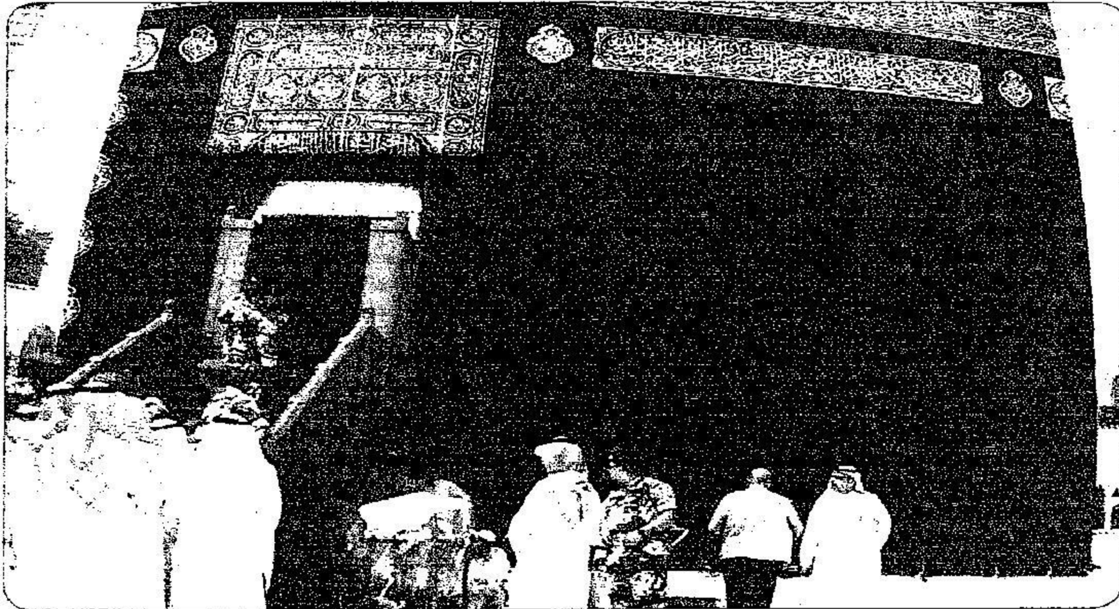
مراسم تبديل الكسوة شهدت حضور عدد من المسؤولين

كما توجد تحت الحزام آيات قرآنية مكتوب كل منها داخل إطار منفصل، ويوجد في الفواصل التي بينها شكل قنديل مكتوب عليه يا حي يا قيوم يا رحمن يا رحيم، الحمد لله رب العالمين. ومطرز الحزام بتطريز بارز مغطى بسلك فضي مطلي بالذهب، ويحيط بالكعبة المشرفة بكاملها. وتشتغل الكسوة على ستارة باب الكعبة، ويُطلق عليها البرقع، وهي معمولة من الحرير بارتفاع ستة أمتار ونصف، ويعرض ثلاثة أمتار ونصف، مكتوب عليها آيات قرآنية، ومزخرفة بزخارف إسلامية مطرزة تحليزًا بارزًا مغطى بأسلاك الفضة المطلية بالذهب. وتتكون الكسوة من خمس قطع تغطي كل قطعة وجهًا من أوجه الكعبة المشرفة، والقطعة الخامسة هي الستارة التي توضع على باب الكعبة، ويتم توصيل هذه القطع مع بعضها البعض.