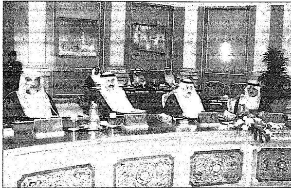
جانب من الجلسة

وقال معاليه "إن المجلس أعرب عن ارتياحه لاعتقاد مجموعة العمل المالي (الفاتف) ومجموعة العمل المالي لدول الشرق الأوسط وشمال أفريقيا (البيتا فاتف) تقرير تحقيق المملكة أعلى درجات الالتزام بالتوصيات الـ ٤٠ المتعلقة بمكافحة غسل الأموال، والتوصيات الخاصة التسع المتعلقة بمكافحة تمويل الإرهاب، ووضع المملكة في المرتبة الأولى عربيا وأحد المراكز العشرة الأولى في ترتيب دول مجموعة العشرين" معبرا عن تقديره لاعتراض المجتمع الدولي بجهود المملكة المبذولة لمكافحة غسل الأموال وتمويل الإرهاب؛ إدراكا منها لما تنطه هاتان الجريمتان من مخاطر على النظام المالي وغير المالي المحلي والإقليمي والدولي. وأفاد معالي وزير الثقافة والإعلام، أن المجلس