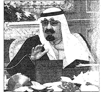
خادم الحرمين خلال ترؤسه جلسة مجلس الوزراء أمس