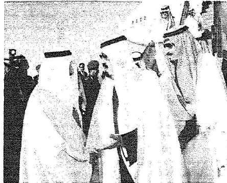
الملك لدى وصوله الرياض أمس يرافقه الأمير سلمان ويبدو في العيد في استقباله.