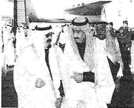
... وهذا في حديث مع الأمير سلمان بعد وصوله لرياض.