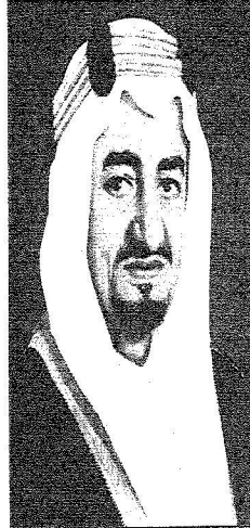
الملك فيصل (1964 - 1975)