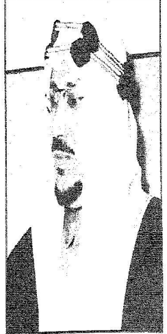
الملك سعود (1933 - 1964)