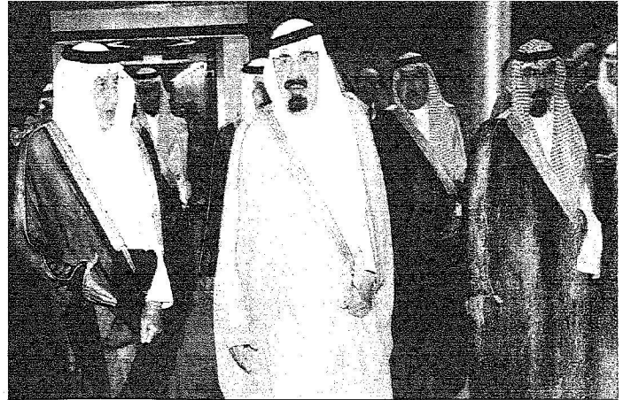
خادم الحرمين لدى وصوله إلى جدة (و.أ.س)