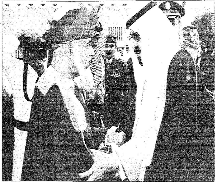
خادم الحرمين الشريفين ينادر عمان أمس وفي صباحه السلطان قابوس بن سعيد محتفياً بزيارة رسمية استمرت ثلاثة أيام وسدس بيان مشترك في ختامها.