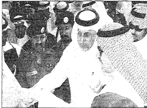
الأمير خالد الفيصل يراجع مخططات الموقع المتضررة