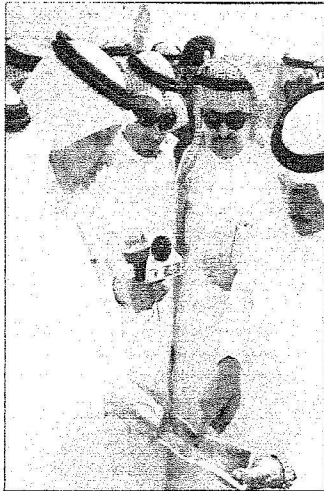
الأمير خالد والأمير مشعل أثناء استماعهما لشرح المهندس الزهراني