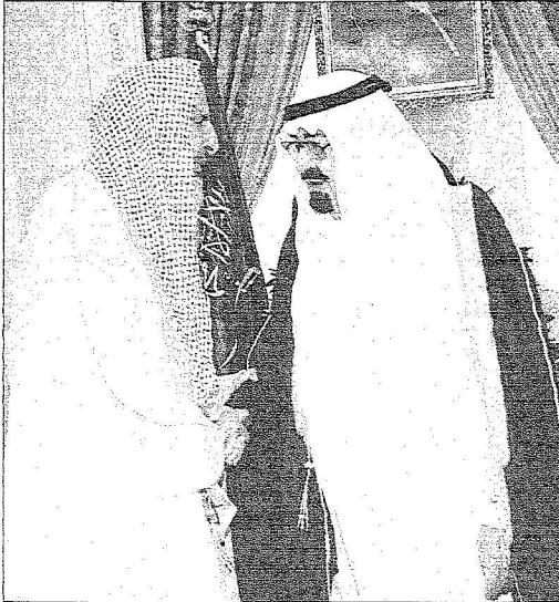
..ويستقبل مفتي عام المملكة. (واس)