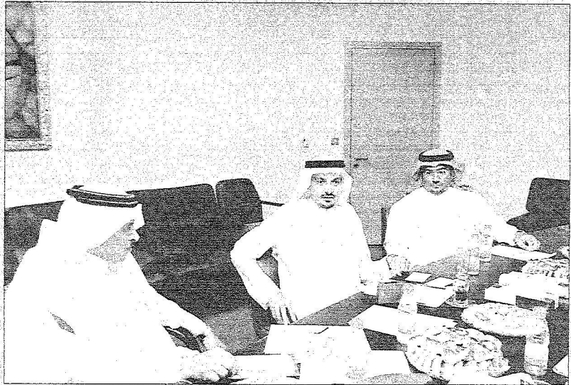
جانب من المشاركين

أقترح تشكيل لجان خاصة بمتابعة الشاريع منذ بدايتها وحتى الانتهاء الشفافية في اليزانية تتطلب تحديد تواريخ التنفيذ