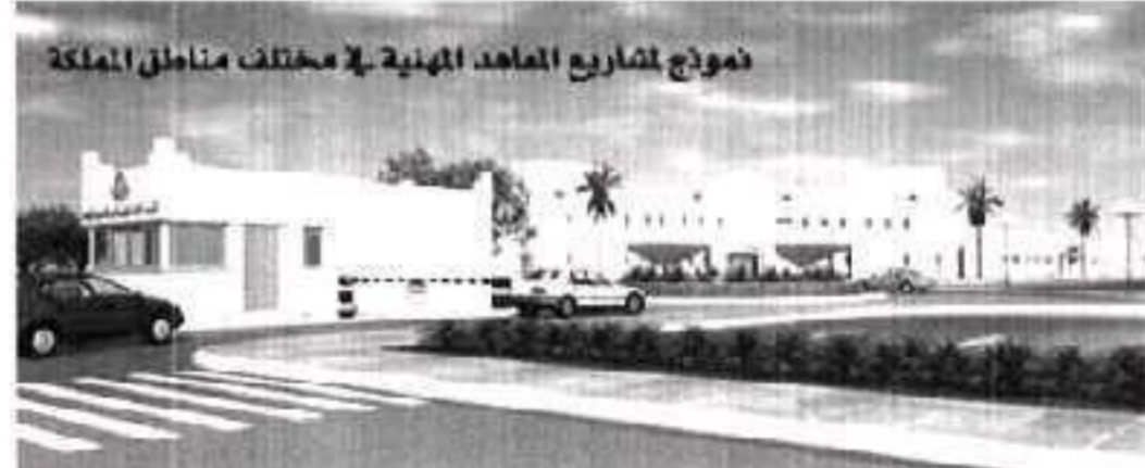
نموذج لمشروع المعاهد المهنية في مختلف مناطق المملكة