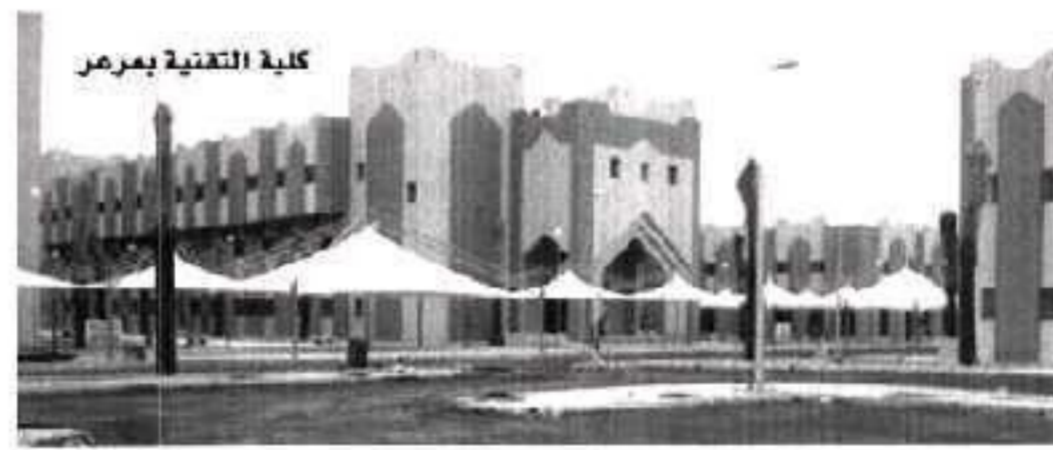
كلية التقنية بمرمر

مجموع مشروعات التعليم الفني والتدريب المهني في ميزانية ١٤٢٨/٢٧ هـ قد بلغ ٢٥٠ مشروعاً. هذا إلى جانب المشروعات الإدارية من مزار إدارية وسكنية ومشاريع الترميمات والإضافات للمنشآت القائمة. إن مستقبلاً زاهراً ينتظر التدريب التقني والمهني في بلادنا فصي هذا الانجاه يسير العالم المعاصر. وملاحم النهضة التنموية التي نفض على أعتابها في هذا العهد المبارك ونحن نشتم عقب ذكرى تأسيس هذا الوطن على يد المؤسس المسلك عبدالعزيز - طيب الله ثراه - تشير إلى حاجة متزايدة لمخرجات هذا النوع من التدريب.