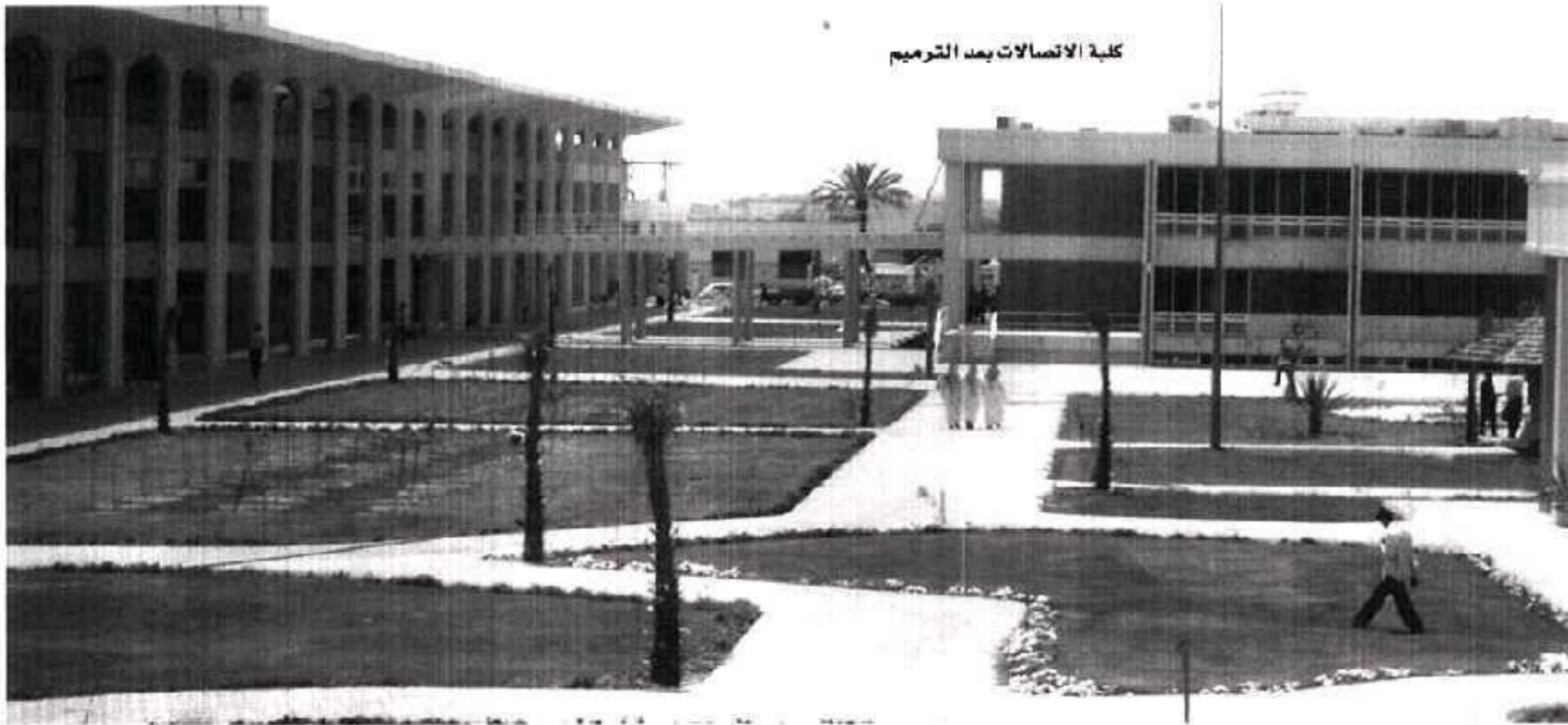
كلية الاتصالات بعد الترميم