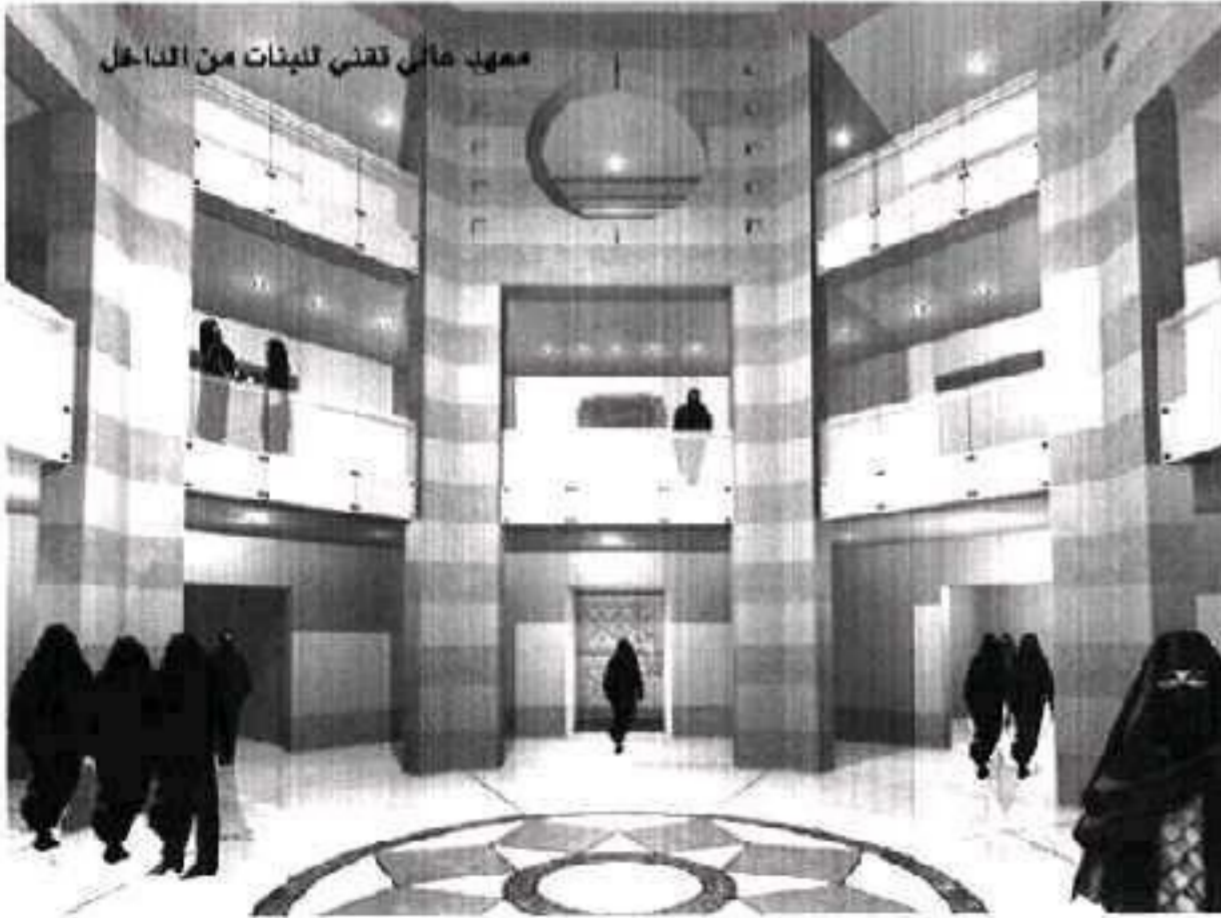
معهد مائل تقني للبنات من الداخل